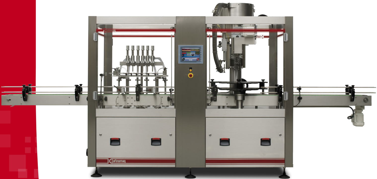
Modelo | Model | Modelo | Modèle MB 2 600

MONOBLOCO :: MONOBLOCK MONOBLOC :: MONOBLOC